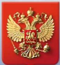
Аппарат Гос. Думы Фед. Собрания РФ