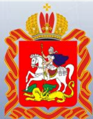
ГУ Региональной Безопасности МО