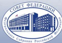
Аппарат Совета Федерации Федерального Собрания Российской Федерации